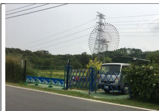
圖一、生態樂活農場

我們過去兩年與青年學子合作建構生態樂活農場如圖一所示，目前已完成一半。為完善推動農業六級化概念與開發農特產品商品展，我們在校園內籌設生態樂活商舖如圖二所示。藉由兩個籌設平台，我們進行健康產業與樂活產業的創新教學與實踐學習。一年來經由同學的學習態度與問卷了解，發現學生對此教學方式相當認可，同時學生也收穫良多。圖三為學生實踐學習內容，圖四為期末進行生態農場商品展，教學主要目標為學習生活化，善用自己手機、網路，進行上課內容、實作項目與現代生活相結合。