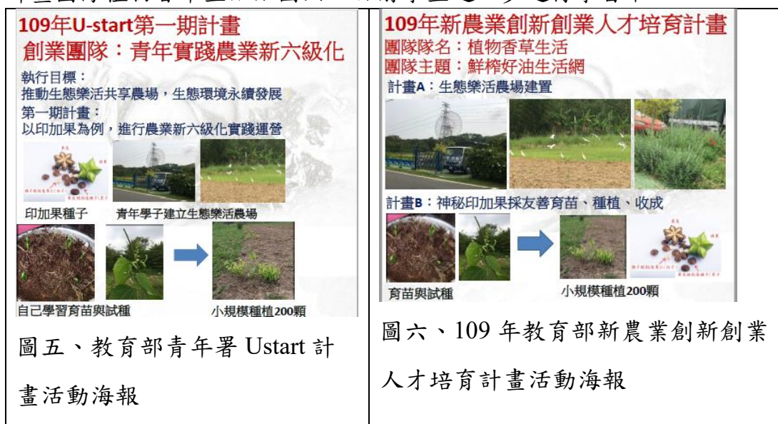
圖五、教育部青年署 Ustart 計畫活動海報

協助學生籌組完成團隊申請通過教育部青年署 Ustart 計畫團隊青年實踐新農業六級化如圖五，同時參加 109 年教育部新農業創新創業人才培育計畫團隊植物香草生活如圖六，目前學生進一步進行學習中。