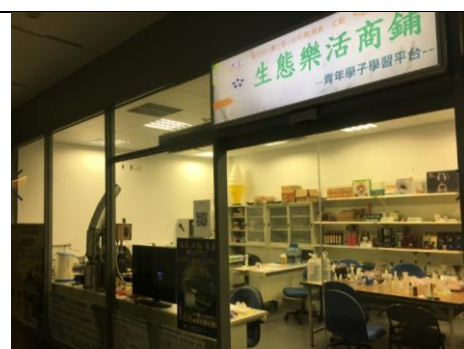
圖二、生態樂活商舖